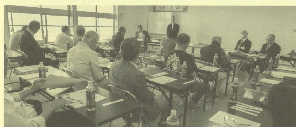
令和8年5月16日の総会