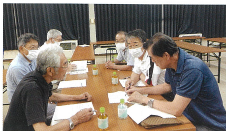
松川・木の沢地区

心豊かに暮らせる住みよい地域づくりには、人と人のつながりが今まで以上に大切になっています。そこには、近年家族の在り方が変わり、若い世代が同居せず、地域に高齢者世帯が多くなってきている背景があります。