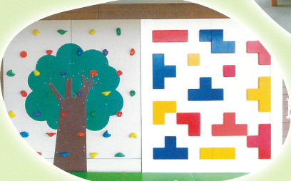
筋力やバランス感覚を鍛えられるボルダリング