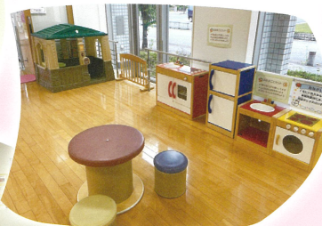
みんな大好き! ままごとコーナー