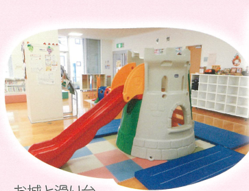
お城と滑り台中でも遊べます

育児の悩みを一人で抱えこまずに、遊びに来てみませんか? 子育てについての相談、情報提供、親子が遊ぶ場、交流の場として子育て家庭を応援します。