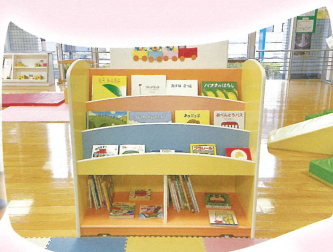
楽しい本いっぱいの絵本コーナー