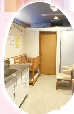
オムツ交換台もある授乳室