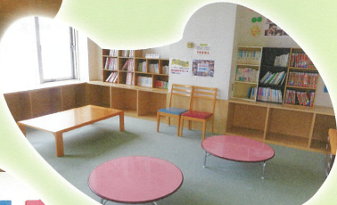
読書のほかに、学習室としてもつかえます