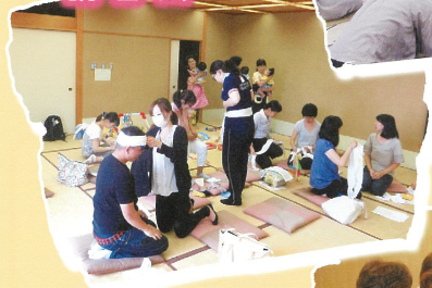
ファミリー・サポート・センター 講習会