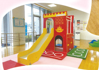
アスレチックつきすべり台