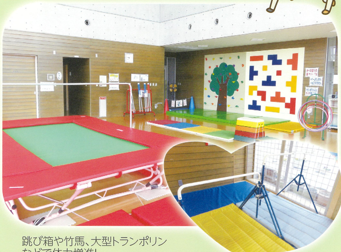
跳び箱や竹馬、大型トランポリンなどで体力増進!