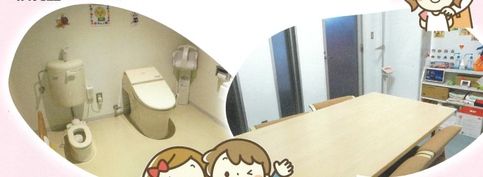
子どもと一緒に使える清潔なトイレ