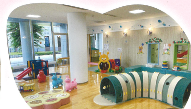
赤ちゃん和妈妈がのんびり過ごせるコーナー