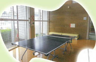
人気の卓球コーナー