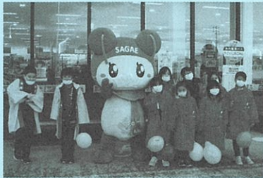
「ねっこクラブ」ボランティア活動 =赤い羽根共同募金=