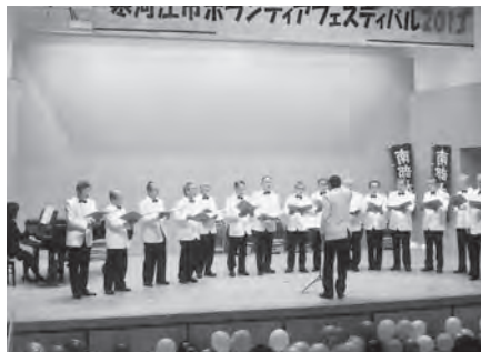
ステージ発表ハミングバース(天童市)