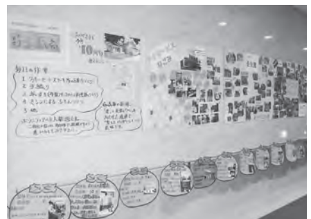
活動紹介コーナー

ひとり暮らしの高齢者 ふれあいの集い …庄内で楽しく交流… ひとり暮らしの高齢者の方々に楽しい仲間づくりの交流を深めていただくために、毎年2回、『ふれあいの集い』を開催しています。1回目は温泉地への“小旅行”、2回目は秋に山形の秋の風物詩“いも煮会”を行っています。