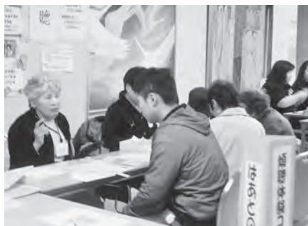
傾聴体験コーナー はあとの会