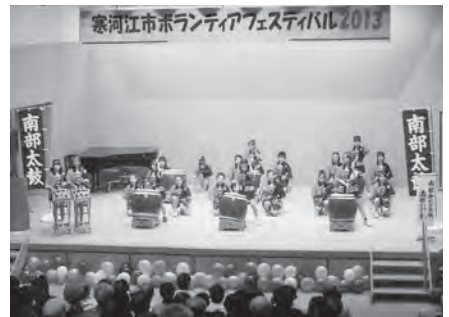
ステージ発表 南部小学校