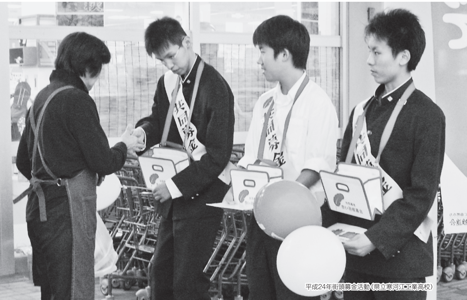
平成24年街頭募金活動(県立寒河江工業高校)