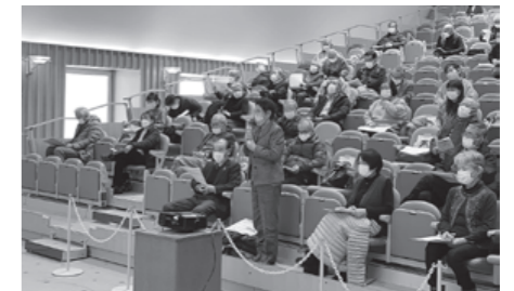
令和4年2月に実施した「これからの地域づくり講演会」

寒河江市より委託を受け、地域に必要な生活支援・介護予防サービスの開発や担い手の養成、地域住民、NPO・介護事業所などの関係者間のネットワーク等、多様な主体をつなぐ役割を担います。