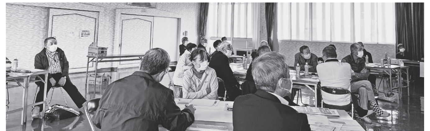
高松地区社会福祉協議会 研修会の様子