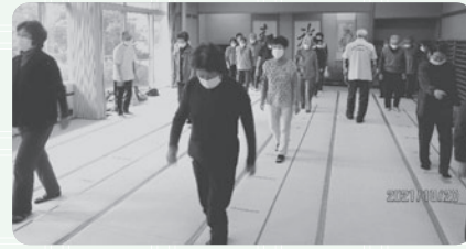
頭と体を使う運動コグニサイズから

また、ゲートボール大会やグラウンドゴルフ大会を企画しています。グラウンドゴルフにあっては、お一人からでも参加できます。初めての方大歓迎です。新たな出会いにチャレンジしてみませんか。イベント開催時や5人以上のグループ利用はマイクロバスで送迎します。是非、ご利用ください。