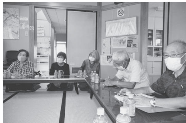
谷沢地区老人クラブとの意見交換会

・ 40を超えていた団体が現在12団体 となり、毎年減少している。 ・ 社会貢献活動や義務的な参加が敬 遠されている。「自分たちが楽しむ」 ことが第一だ。