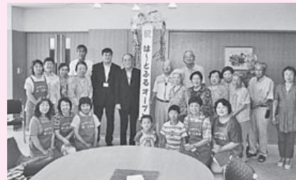
まちなかサロン「ふれあいカフェは〜とふる」