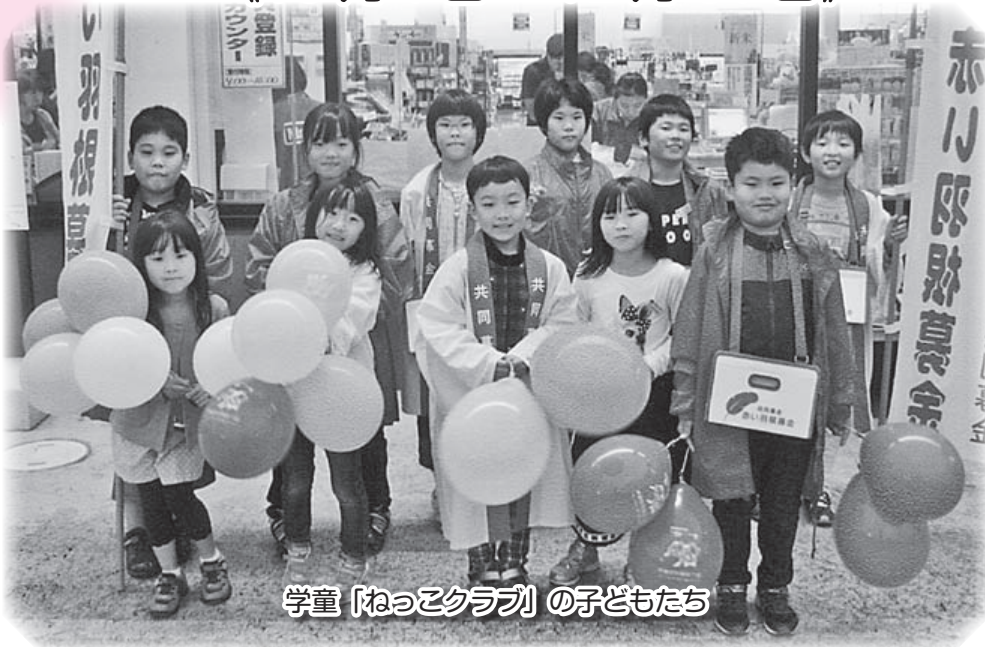
学童「ねっこクラブ」の子どもたち

あなたのやさしさが、あなたの声、あなたの行動が、きっと、町を変えていくはじめの一歩になるはずです。そして、そして、良い町になりますように。