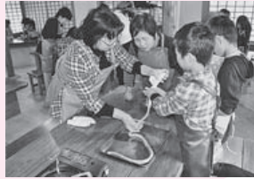
寒河江学園一日おたのしみ体験