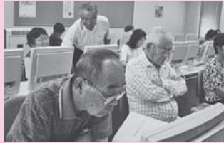
シニアパソコン教室