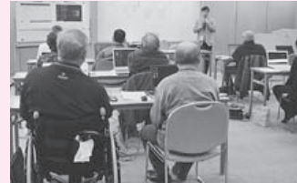
身体障がい者のためのパソコン教室