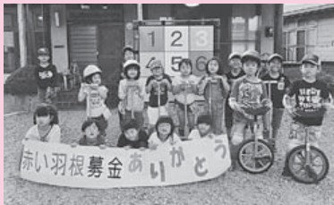
第2なかよしクラブ