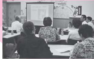
地区社協研修(白岩地区社協)

地区社協活動費、福祉と健康のまち大会開催事業、ふれあい相談所設置事業、まちなかサロン開設事業など