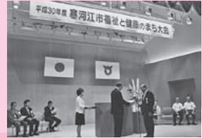
寒河江市福祉と健康のまち大会