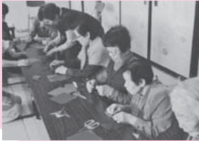
ふれあいサロン(南部コスモス会)

ふれあいサロン事業、シニアパソコン教室、老人福祉大会や老人体育レクリエーション大会開催事業など