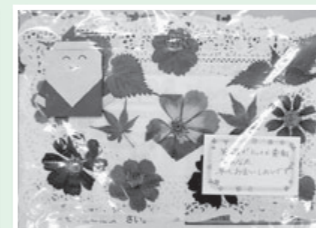
押し花テーブルセンター

社会福祉協議会では、年間を通して寄付を受け付けています。寄付金には、所得税・住民税・法人税等の所得控除が認められています。優遇税制をご利用いただき、ぜひご支援をお願いいたします。