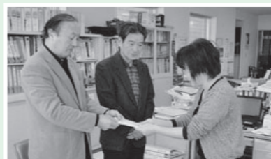
西根南部公民館 様